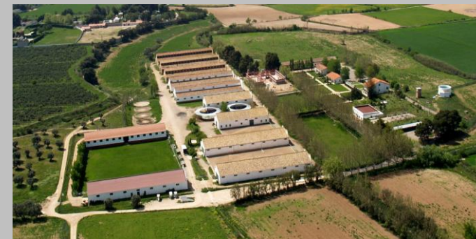
Vista aérea del Centro Militar de Cría Caballar de Zaragoza