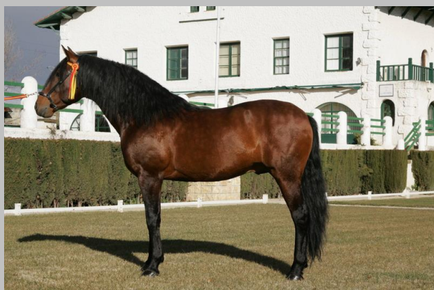
RENO II (P.R.E.)