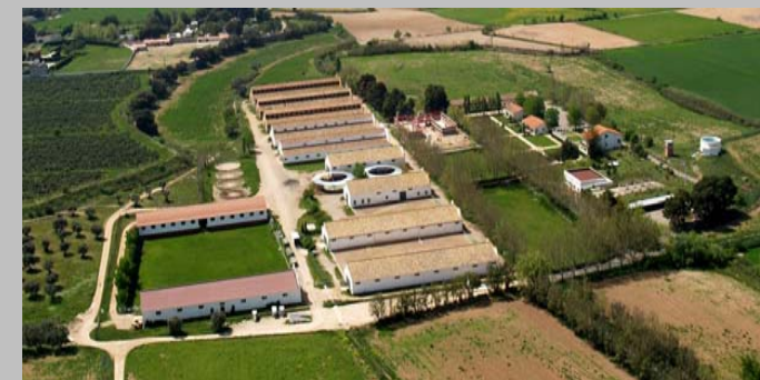
Vista aérea del Centro Militar de Cría Caballar de Zaragoza