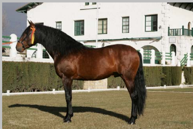
RENO II (P.R.E.)

PENDIENTE DE PUBLICACIÓN LOS NUEVOS PRECIOS DEL 2010